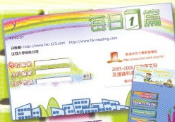
中文每日一篇版面

設中、英文每日一篇網上閱讀，為同學訂購「星島日報」及設壁報板「新聞焦點」，讓學生每天皆能閱讀，豐富課外知識。