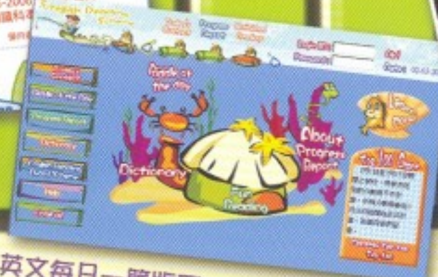
英文每日一篇版面